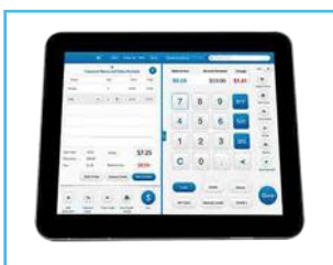
Monitor LCD 9.6"