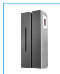
Lector de Tarjeta y Lector de Huella